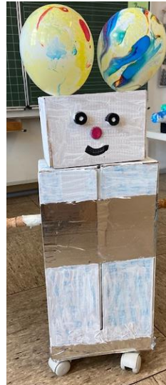
Aus geometrischen Formen haben wir Roboter gebastelt.