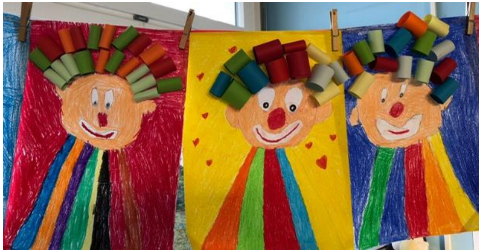
Bunte Clowns sind an Fasching entstanden.