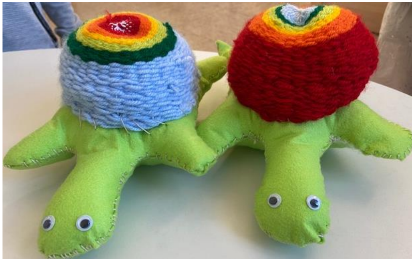
Mit den Techniken Weben und Nähen werden Schildkröten hergestellt.