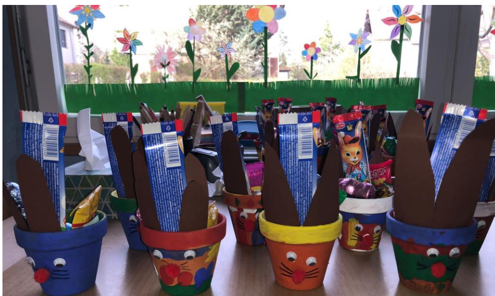
Die Osternester sahen auch toll aus.