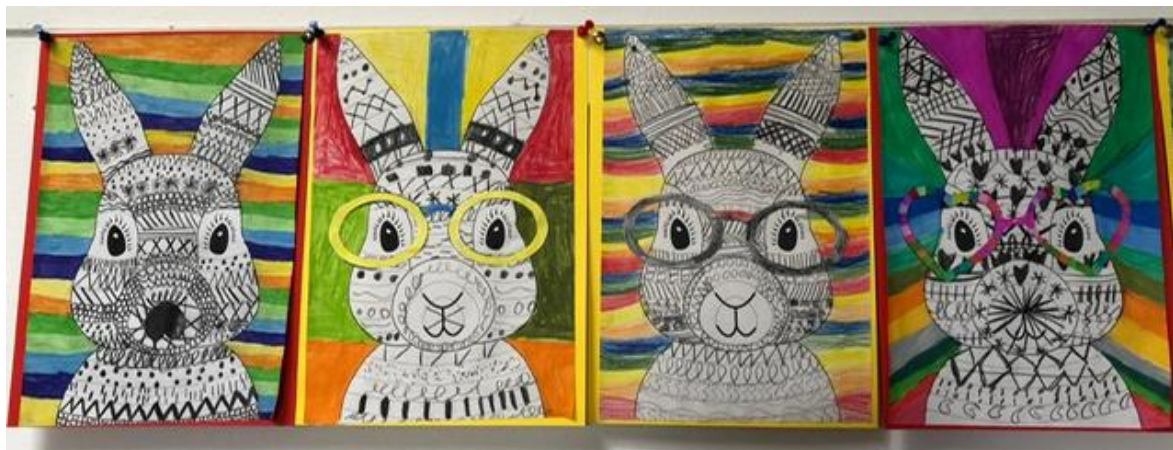
An Ostern wurden bunte Osterhasen erstellt.